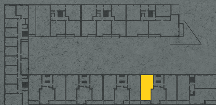
umístění bytu na 1. np