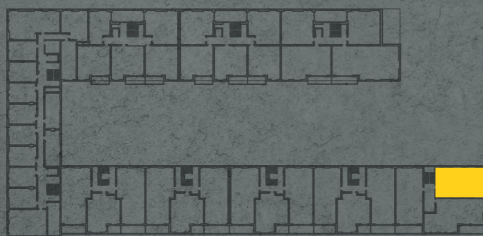
umístění bytu na 2. np