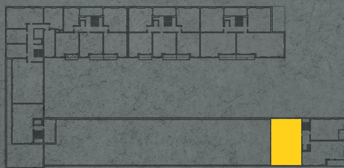
umístění bytu na 3. np