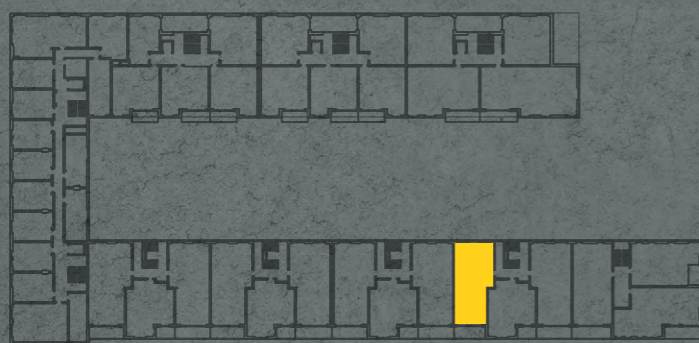
umístění bytu na 2. np