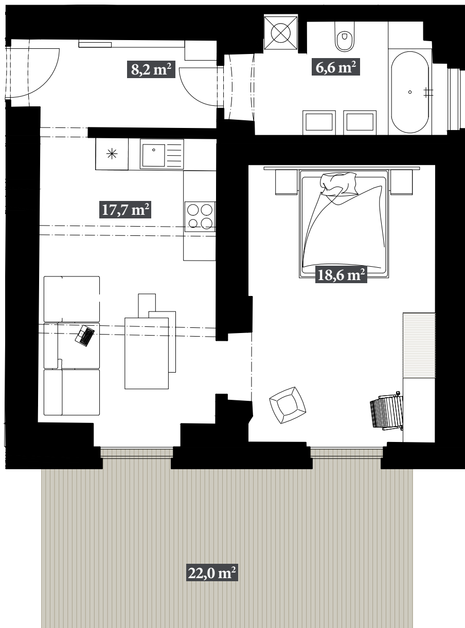
Schéma půdorysu představuje dispoziční řešení. Vybavení kuchyňskou linkou, vestavěnými skříněmi, nábytkem apod. není předmětem prodeje. Plochy jednotlivých místností jsou orientační. Developer si vyhrazuje právo na změnu.