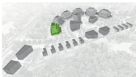
umístění bytového domu v projektu