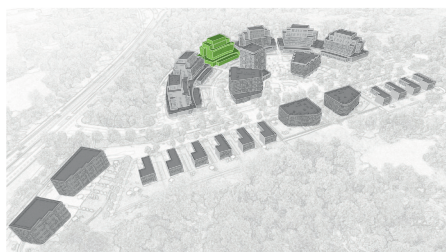
umístění bytového domu v projektu