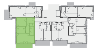
umístění bytu na 1. np

Plochy jednotlivých místností jsou orientační. Vyobrazené zařízení v plánech bytů (nábytek, kuchyňská linka, elektrické spotřebiče atd.) nejsou součástí dodávky. Rozsah dodávky je specifikován ve standardu bytu. Investor si vyhrazuje právo na drobné úpravy.