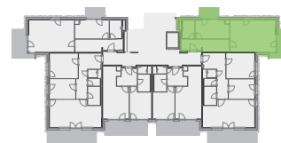
umístění bytu na 1. np