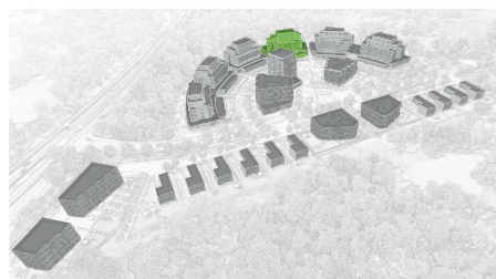
umístění bytového domu v projektu