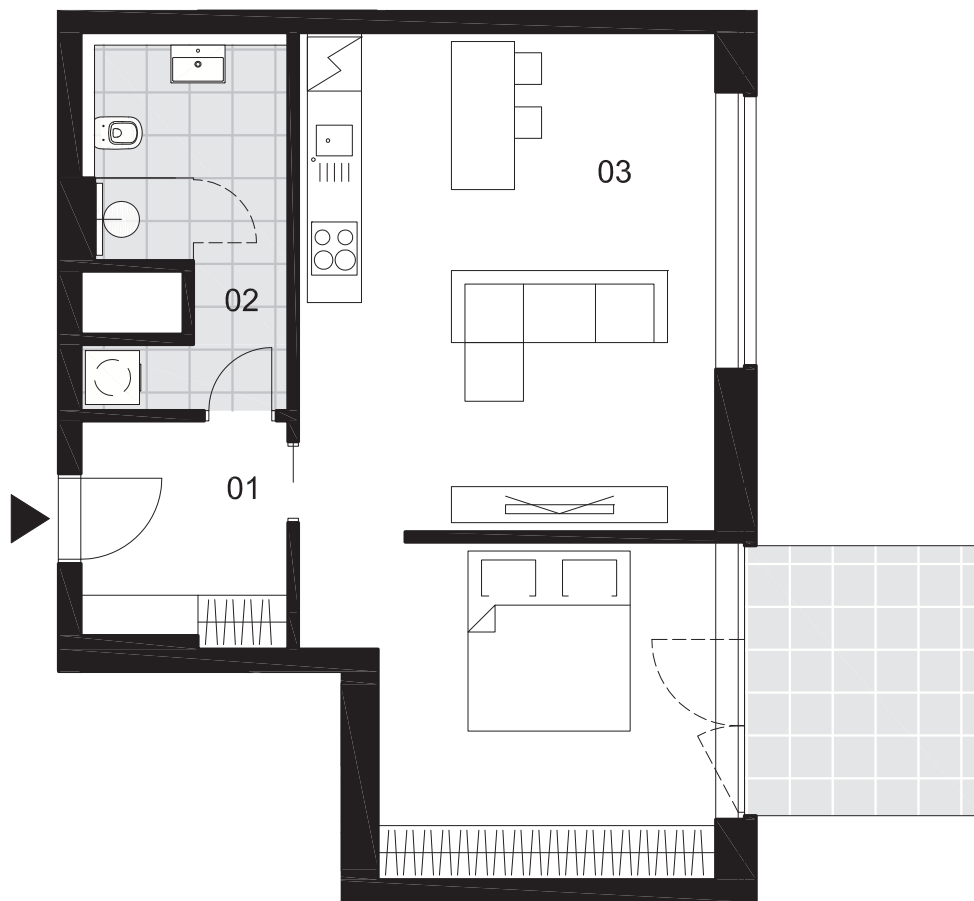
Schéma podlaží 5.NP