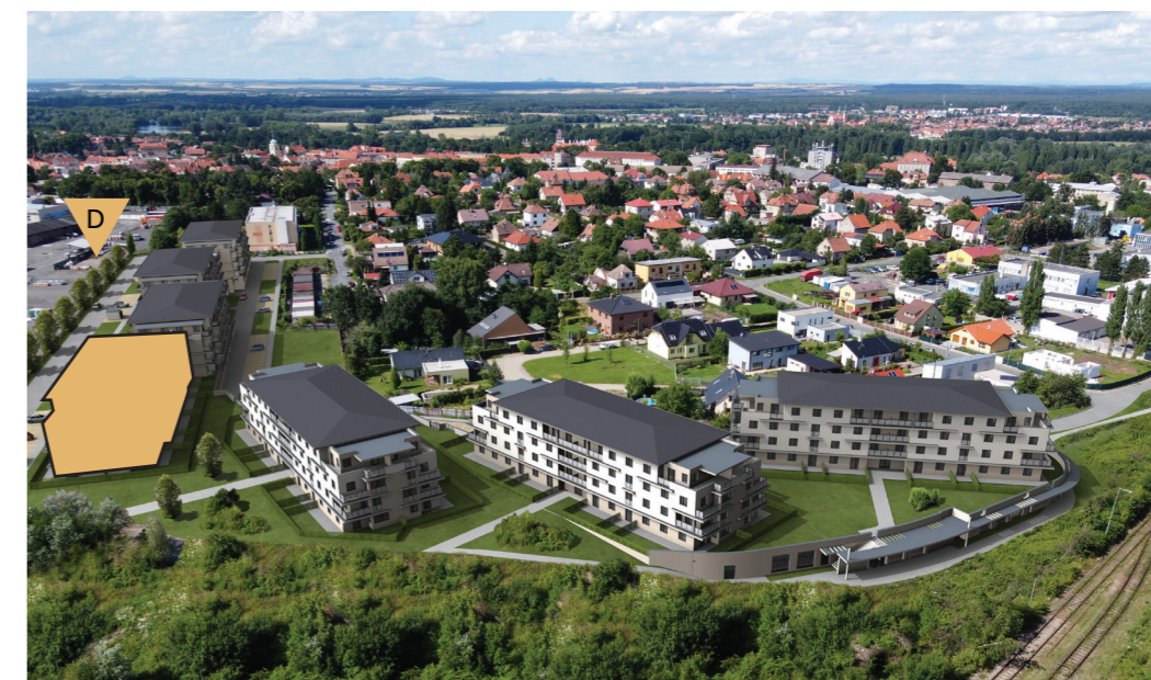
Budova D | nadhledová axonometrie