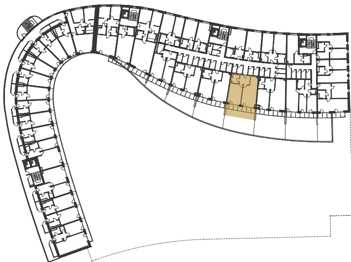
SCHÉMA UMÍSTĚNÍ JEDNOTKY NA PODLAŽÍ / M 1:1000