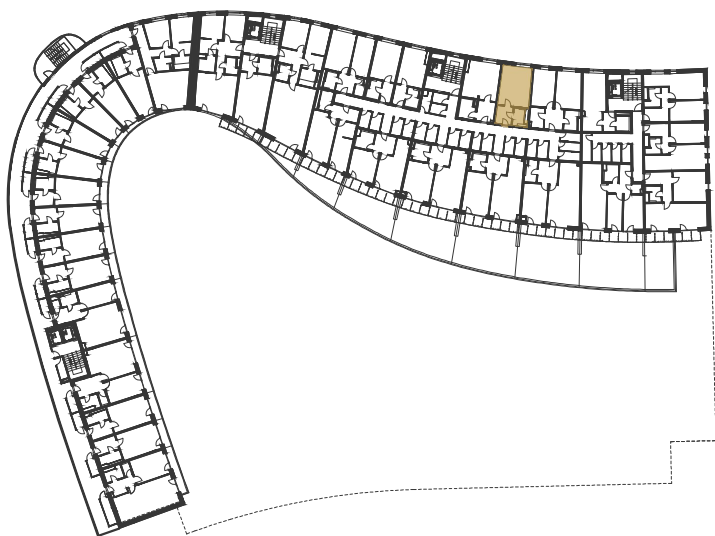
SCHEMA UMÍSTĚNÍ JEDNOTKY NA PODLAŽÍ / M 1:1000