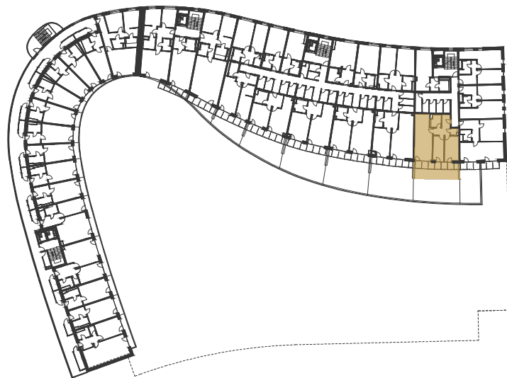
SCHÉMA UMÍSTĚNÍ JEDNOTKY NA PODLAŽÍ / M 1:1000