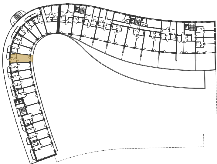
SCHÉMA UMÍSTĚNÍ JEDNOTKY NA PODLAŽÍ / M 1:1000