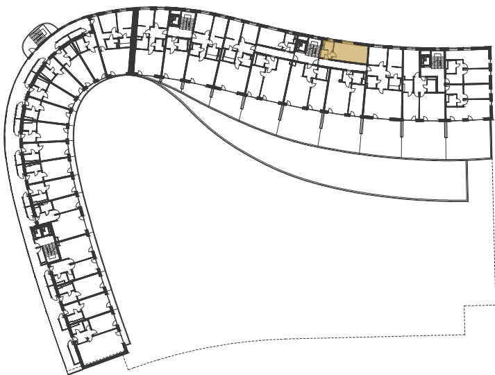
SCHÉMA UMÍSTĚNÍ JEDNOTKY NA PODLAŽÍ / M 1:1000