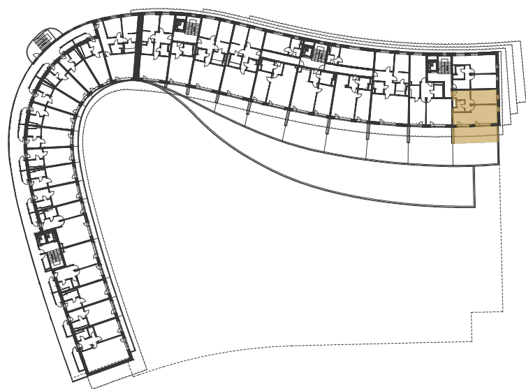
SCHÉMA UMÍSTĚNÍ JEDNOTKY NA PODLAŽÍ / M 1:1000