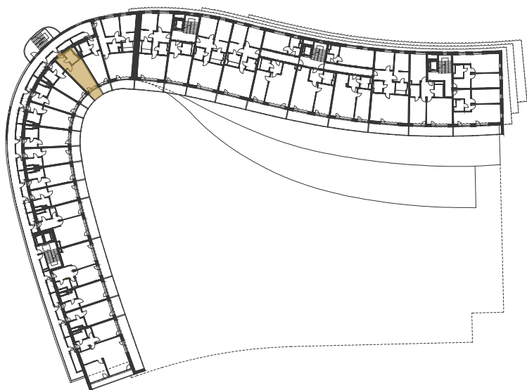
SCHÉMA UMÍSTĚNÍ JEDNOTKY NA PODLAŽÍ / M 1:1000