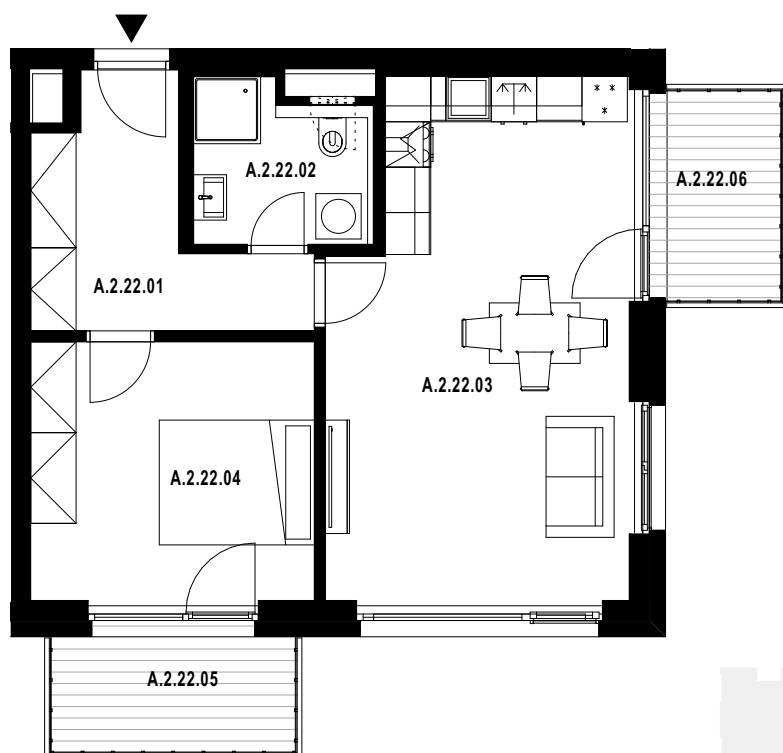
POLOHA JEDNOTKY V RÁMCI PODLAŽÍ