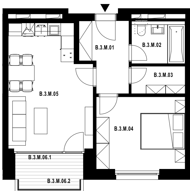
POLOHA JEDNOTKY V RÁMCI PODLAŽÍ