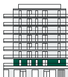
2. patro 2nd Floor