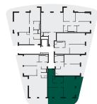
umístění bytu na patře apartment location

Poznámka: Tento výkres byl zpracován pro marketingové účely. Plochy jednotlivých místností jsou pouze orientační. Vyobrazené zařízení v půdorysu (nábytek, kuchyňská linka, elektrické spotřebiče, atd.) není součástí dodávky. Rozsah dodávky, specifikace konstrukcí, povrchové úpravy a vybavení jsou specifikovány ve standardním provedení, které je přílohou smlouvy. Podlahová plocha bytu (ateliéru) je měřena dle nařízení vlády 366/2013Sb. Developer se tímto nevzdává práva na případné změny, úpravy či doplnění tohoto marketingového materiálu.