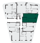
umístění bytu na patře apartment location

Poznámka: Tento výkres byl zpracován pro marketingové účely. Plochy jednotlivých místností jsou pouze orientační. Vyobrazené zařízení v půdorysu (nábytek, kuchyňská linka, elektrické spotřebiče, atd.) není součástí dodávky. Rozsah dodávky, specifikace konstrukcí, povrchové úpravy a vybavení jsou specifikovány ve standardním provedení, které je přílohou smlouvy. Podlahová plocha bytu (ateliéru) je měřena dle nařízení vlády 366/2013Sb. Developer se tímto nevzdává práva na případné změny, úpravy či doplnění tohoto marketingového materiálu.