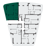
umístění bytu na patře apartment location

Poznámka: Tento výkres byl zpracován pro marketingové účely. Plochy jednotlivých místností jsou pouze orientační. Vyobrazené zařízení v půdorysu (nábytek, kuchyňská linka, elektrické spotřebiče, atd.) není součástí dodávky. Rozsah dodávky, specifikace konstrukcí, povrchové úpravy a vybavení jsou specifikovány ve standardním provedení, které je přílohou smlouvy. Podlahová plocha bytu (ateliéru) je měřena dle nařízení vlády 366/2013Sb. Developer se tímto nevzdává práva na případné změny, úpravy či doplnění tohoto marketingového materiálu.