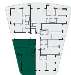
umístění bytu na patře apartment location

Poznámka: Tento výkres byl zpracován pro marketingové účely. Plochy jednotlivých místností jsou pouze orientační. Vyobrazené zařízení v půdorysu (nábytek, kuchyňská linka, elektrické spotřebiče, atd.) není součástí dodávky. Rozsah dodávky, specifikace konstrukcí, povrchové úpravy a vybavení jsou specifikovány ve standardním provedení, které je přílohou smlouvy. Podlahová plocha bytu (ateliéru) je měřena dle nařízení vlády 366/2013Sb. Developer se tímto nevzdává práva na případné změny, úpravy či doplnění tohoto marketingového materiálu.