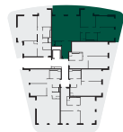
umístění bytu na patře apartment location

Poznámka: Tento výkres byl zpracován pro marketingové účely. Plochy jednotlivých místností jsou pouze orientační. Vyobrazené zařízení v půdorysu (nábytek, kuchyňská linka, elektrické spotřebiče, atd.) není součástí dodávky. Rozsah dodávky, specifikace konstrukcí, povrchové úpravy a vybavení jsou specifikovány ve standardním provedení, které je přílohou smlouvy. Podlahová plocha bytu (ateliéru) je měřena dle nařízení vlády 366/2013Sb. Developer se tímto nevzdává práva na případné změny, úpravy či doplnění tohoto marketingového materiálu.