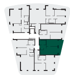
umístění bytu na patře apartment location

Poznámka: Tento výkres byl zpracován pro marketingové účely. Plochy jednotlivých místností jsou pouze orientační. Vyobrazené zařízení v půdorysu (nábytek, kuchyňská linka, elektrické spotřebiče, atd.) není součástí dodávky. Rozsah dodávky, specifikace konstrukcí, povrchové úpravy a vybavení jsou specifikovány ve standardním provedení, které je přílohou smlouvy. Podlahová plocha bytu (ateliéru) je měřena dle nařízení vlády 366/2013Sb. Developer se tímto nevzdává práva na případné změny, úpravy či doplnění tohoto marketingového materiálu.