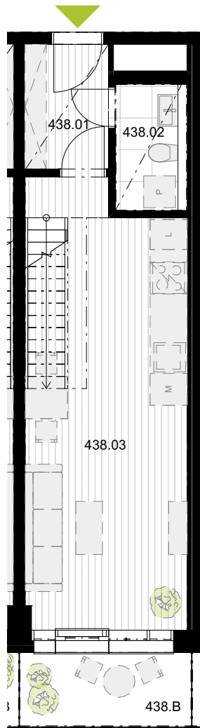
PŮDORYS 4.NP spodní podlaží