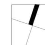
PŮDORYS JEDNOTKY / M 1:100