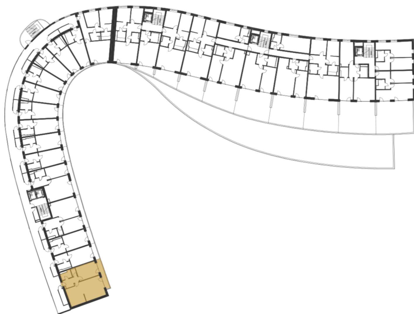
SCHÉMA UMÍSTĚNÍ JEDNOTKY NA PODLAŽÍ / M 1:1000