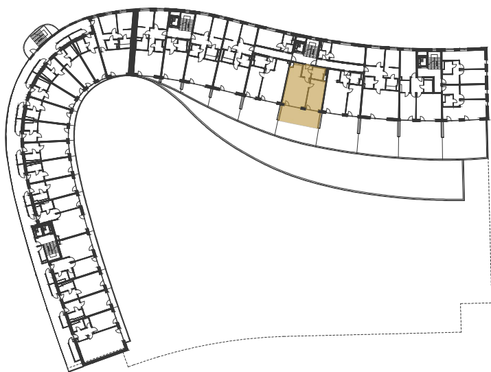
SCHÉMA UMÍSTĚNÍ JEDNOTKY NA PODLAŽÍ / M 1:1000