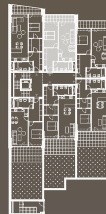
situace bytové jednotky celkový půdorys