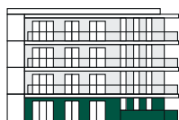
1. patro 1st Floor