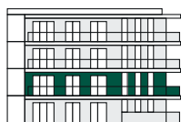
2. patro 2nd Floor