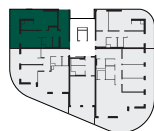
umístění bytu na patře apartment location

Poznámka: Tento výkres byl zpracován pro marketingové účely. Plochy jednotlivých místností jsou pouze orientační. Vybavení zařízení v půdorysu (nábytek, kuchyňská linka, elektrické spotřebiče, atd.) není součástí dodávky. Rozsah dodávky, specifikace konstrukcí, povrchové úpravy a vybavení jsou specifikovány ve standardním provedení, které je přílohou smlouvy. Podlahová plocha bytu (ateliéru) je měřena dle nařízení vlády 366/2013Sb. Developer se tímto nevzdává práva na případné změny, úpravy či doplnění tohoto marketingového materiálu.