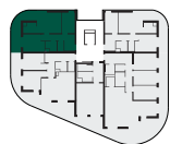
umístění bytu na patře apartment location

Poznámka: Tento výkres byl zpracován pro marketingové účely. Plochy jednotlivých místností jsou pouze orientační. Vyrobené zařízení v půdorysu (nábytek, kuchyňská linka, elektrické spotřebiče, atd.) není součástí dodávky. Rozsah dodávky, specifikace konstrukcí, povrchové úpravy a vybavení jsou specifikovány ve standardním provedení, které je přílohou smlouvy. Podlahová plocha bytu (ateliéru) je měřena dle nařízení vlády 366/2013Sb. Developer se tímto nevzdává práva na případné změny, úpravy či doplnění tohoto marketingového materiálu.