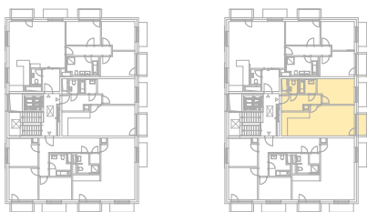
Schéma půdorysu představuje dispoziční uspořádání jednotky. Zobrazené vybavení nábytkem, vestavěné skříně, kuchyňská linka vč. spotřebičů a pračky nejsou součástí dodávky jednotky. Toto zobrazení je pouze pro názornost. Specifikace pro konstrukce, povrchové úpravy a vybavení je předmětem přílohy "Kvalitativní standard".