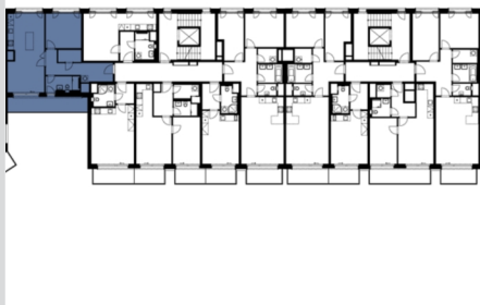
Situační plánek lokality