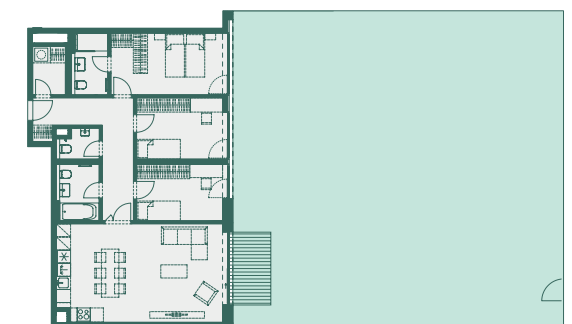
Skutečné proporce zahrady