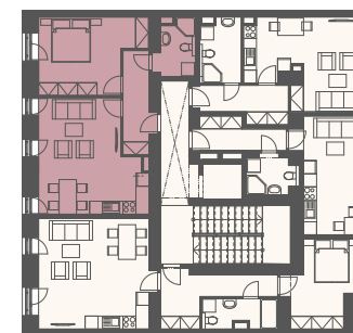
Schéma půdorysu představuje dispoziční řešení. Vybavení kuchyňskou linkou, vestavěnými skříněmi, nábytkem apod. není předmětem prodeje. Plochy jednotlivých místností jsou orientační. Developer si vyhrazuje právo na změnu.

* Podlahová plocha je vypočtena podle nařízení vlády č. 366/2013 Sb. jako půdorysná plocha ohraničená vnitřními stranami obvodových zdí bytu včetně půdorysné plochy všech svislých nosných i nenosných konstrukcí uvnitř bytu. Nezahrnuje balkony, lodžie, terasy, předzahrádky a jiné zpevněné plochy.