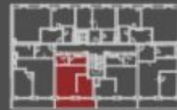
síluce bytové jednotky celkový půdorys