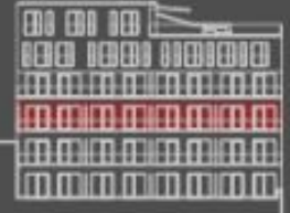
síluce bytové jednotky dvorní pohled