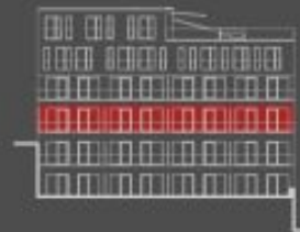
situace bytové jednotky dvorní pohled