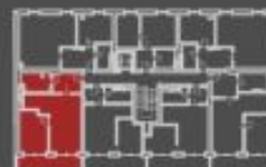
situace bytové jednotky ulčkový půdorys