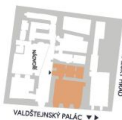
UMÍSTĚNÍ V RÁMCI PODLAŽÍ