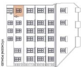
UMÍSTĚNÍ V RÁMCI PODLAŽÍ