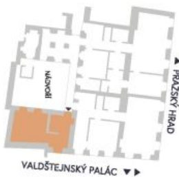
UMÍSTĚNÍ V RÁMCI PODLAŽÍ