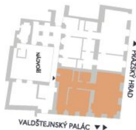
UMÍSTĚNÍ V RÁMCI PODLAŽÍ