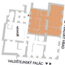
UMÍSTĚNÍ V RÁMCI PODLAŽÍ