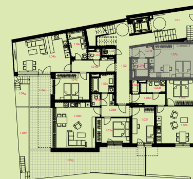
situace bytové jednotky celkový půdorys