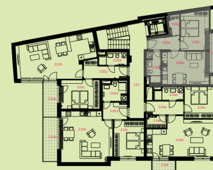
situace bytové jednotky celkový půdorys