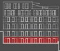
situace bytové jednotky dvorní pohled