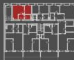
situace bytové jednotky občasný půdorys