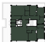
SCHEMA UMÍSTĚNÍ BYTU